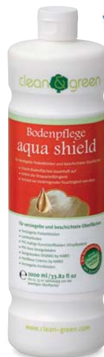
aqua shield Bodenpflege für versiegelte Parkettböden und beschichtete Oberflächen

Mit clean & green aqua shield erstrahlt der Boden in neuem Glanz. Zusätzlich wird die Strapazierfähigkeit der Oberfläche erhöht und vor eindringender Feuchtigkeit von oben geschützt.