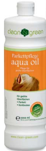
aqua oil Parkettpflege

Zur Auffrischung/Renovierung von strapaziertem, geöltem, sehr dunklem Parkett empfehlen wir aqua oil black. Für weiß geöltes Parkett empfehlen wir aqua oil white.