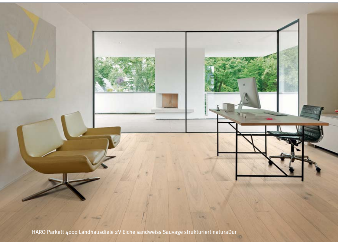
HARO Parkett 4000 Landhausdielen 2V Eiche sandweiss Sauvage strukturiert naturaDur

Hamberger Flooring GmbH & Co. KG Postfach 10 03 53 83003 Rosenheim Deutschland