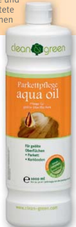
Parkettpflege aqua oil