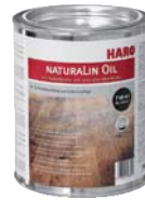
Spa Öl Natura