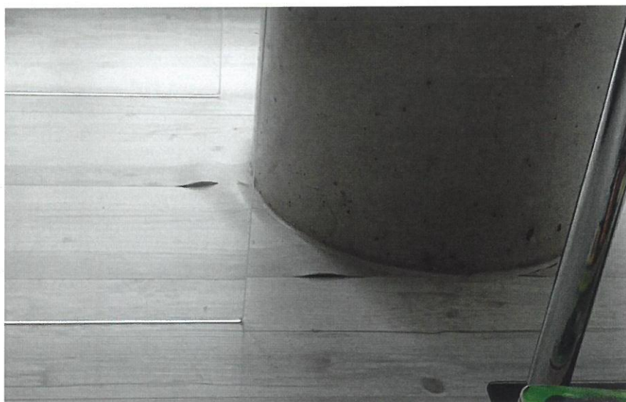
Auch an den Betonpfeilern wurde falsch gearbeitet.

Im unmittelbaren Bereich aller aufgehenden Wände und Säulen wölbten sich die PVC-Designplanken in Form von Wellenbildungen. Dieser Mangel wurde vom Bauherrn beim Bodenleger reklamiert. Der