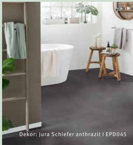
Dekor: Jura Schiefer anthrazit | EPD045