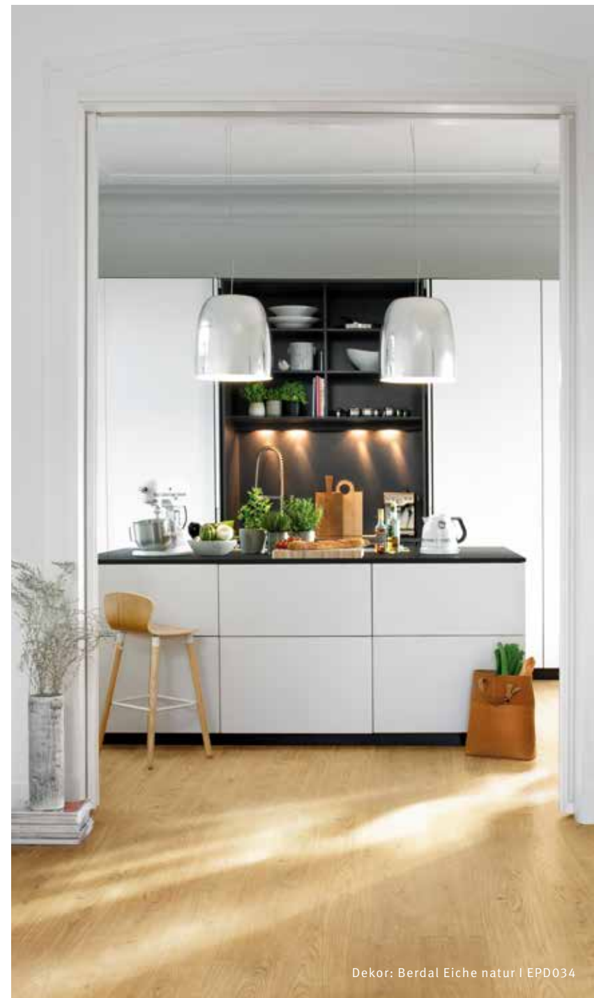
Dekor: Berdal Eiche natur | EPD034

Mehr Informationen: egger.com/pro-design-green tec