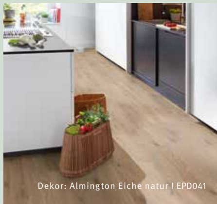
Dekor: Almington Eiche natur | EPD041

Den inneren Werten steht das Äußere in nichts nach: Die authentische Holz- oder Steinoptik macht unseren Design-Boden GreenTec zu einem natürlichen Hingucker in jedem Raum.