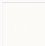
KIEFER RAL 9016 Verkehrsweiß