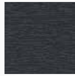
ANTHRAZITGRAU genarbt / glatt / matt