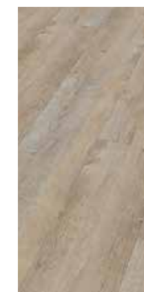
6040 Antikfichte crema