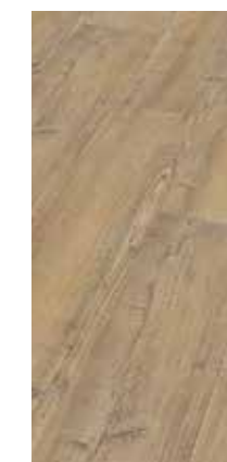
6046 Eiche Stream