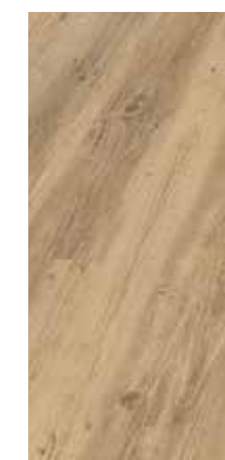
6052 Eiche Melange