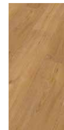
6045 Eiche Natur