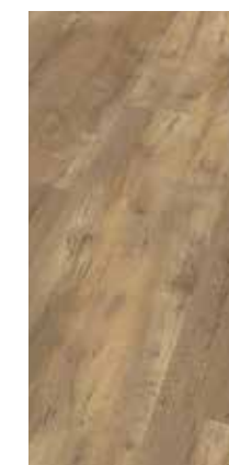
6022 Eiche Hasel