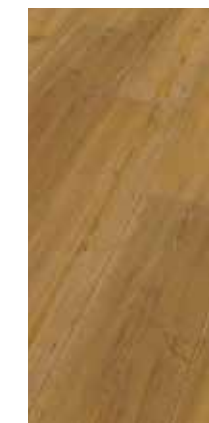
6031 Eiche Azalea