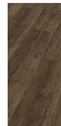
6025 Eiche Myrte