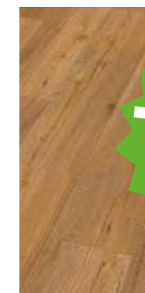
6027 Eiche Linea