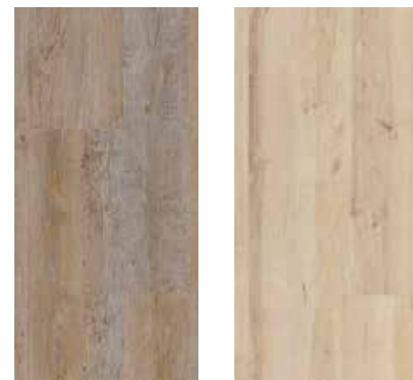
6122 Fichte Pasadena 6124 Birke Portland