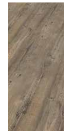
6030 Eiche Stahl