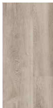
6127 Eiche Hamptons

Ob hell, dunkel, trendy oder zeitlos klassisch – Vinylböden lassen keine Wünsche offen. Sie lassen sich toll kombinieren, auf verschiedenste Arten gestalten und lassen Ihrer Fantasie freien Raum!