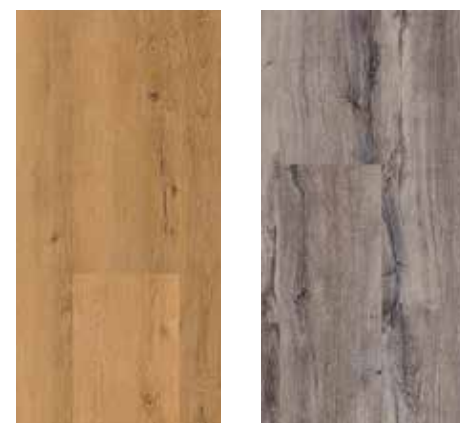
6120 Eiche Kansas 6121 Eiche Daytona

Unsere Spitzenreiter für den kleinen Geldbeutel!