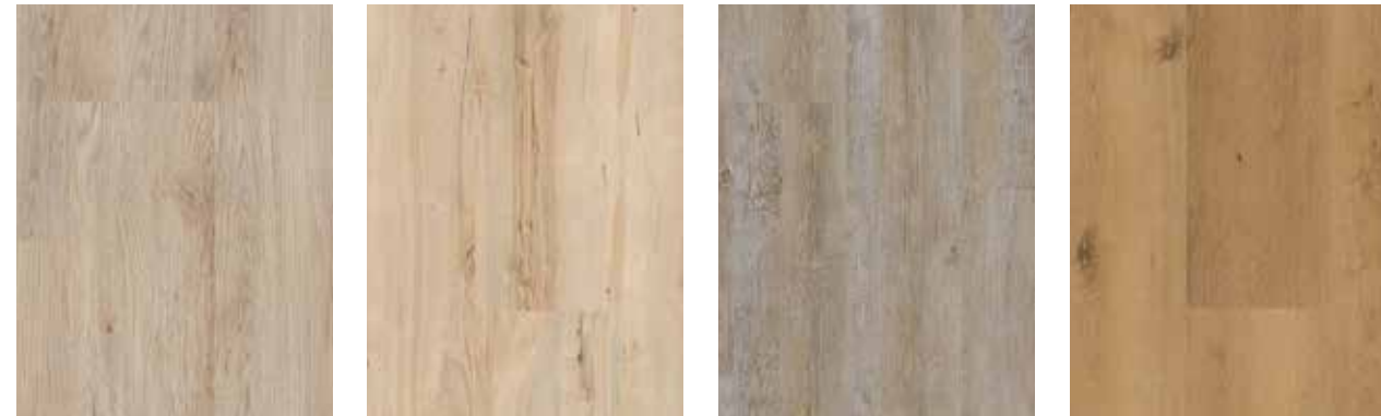
6181 Eiche Nebraska XL 6182 Birke Ohio XL 6183 Fichte Colorado XL 6184 Eiche Phoenix XL