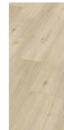
6036 Eiche Lotus