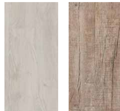
6002 Schneeeiche 6003 Eiche Stonehenge