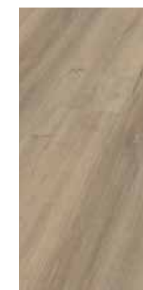
6131 Eiche Grigio