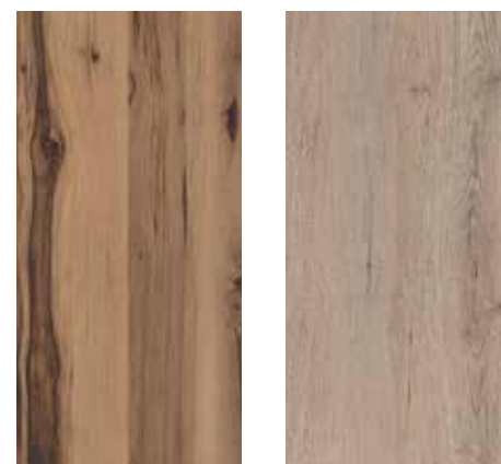
6007 Granatapfel 6008 Samteiche