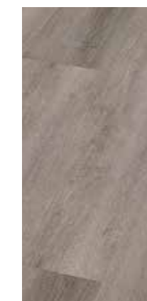
6286 Eiche Gobi XL