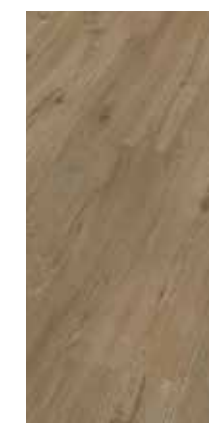
6047 Eiche Cream