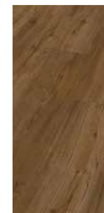
6024 Eiche Maive