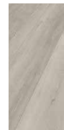
6130 Eiche Basalt