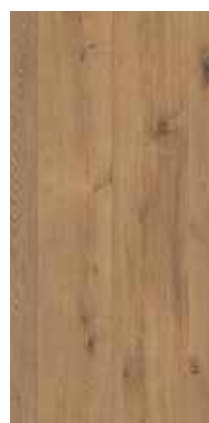
6285 Eiche Vanilla XXL