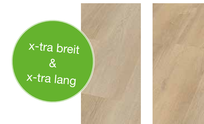
6289 Eiche Patagonia XL 6290 Eiche Victoria XL