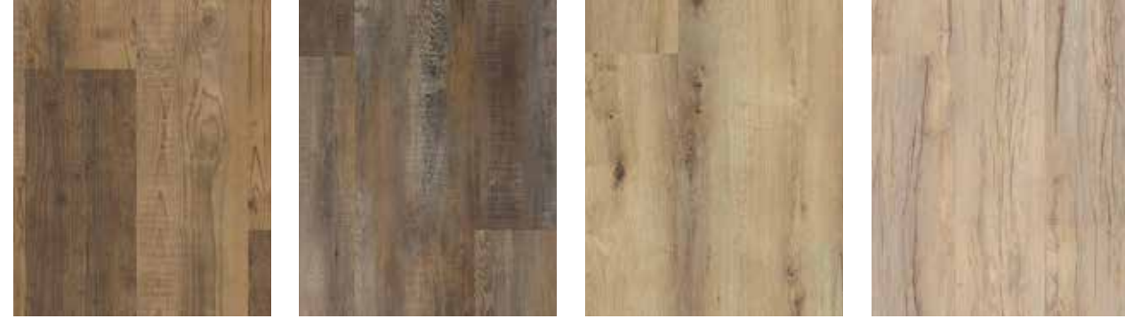
6177 Kiefer Nevada XL 6178 Kiefer Utah XL 6179 Eiche Sacramento XL 6180 Eiche Georgia XL