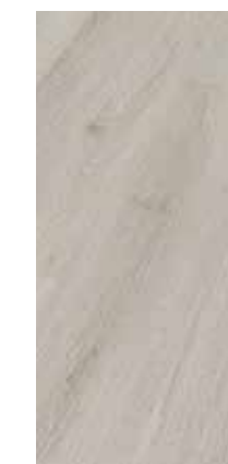
6287 Eiche Karakum XL