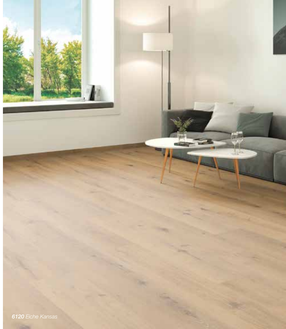
6120 Eiche Kansas

58 Designs 10 Ausführungen 100 Varianten