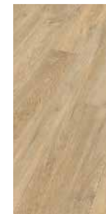
6028 Eiche Ginger