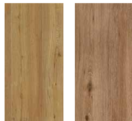
6092 Eiche Rustik XXL 6094 Ossereiche XXL