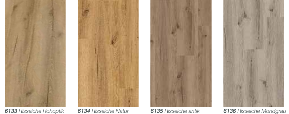
6133 Risseiche Rohoptik 6134 Risseiche Natur 6135 Risseiche antik 6136 Risseiche Mondgrau

Nicht mehr von echter Eiche zu unterscheiden!