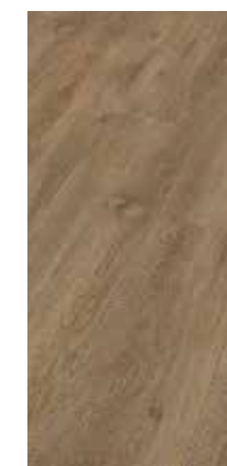
6041 Eiche Olive