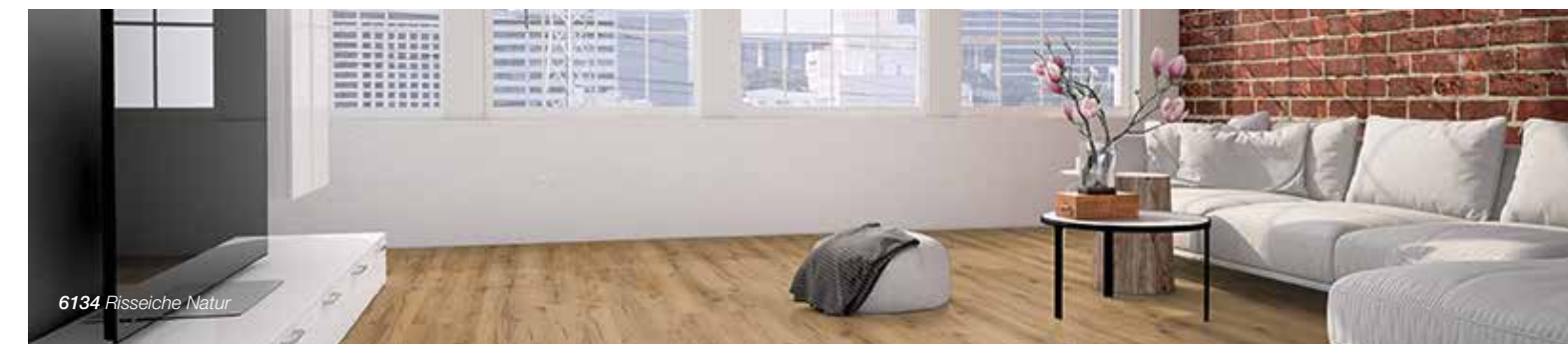
6134 Risseiche Natur

Jedes Astloch, jeder Riss, jede Erhebung und kleine Furche und Rille wird sanft genau dort geprägt, wo sie auch zu sehen ist. Die sogenannte Synchronprägung ist die nächste Stufe der Vinylprägung. Durch diese anspruchsvolle Technik sind softsynchron-geprägte Vinylböden auch haptisch kaum mehr von echtem Holz zu unterscheiden, sie wirken außergewöhnlich naturnah und unverfälscht.