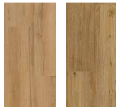
6000 Alpineiche 6001 Eiche Rustik