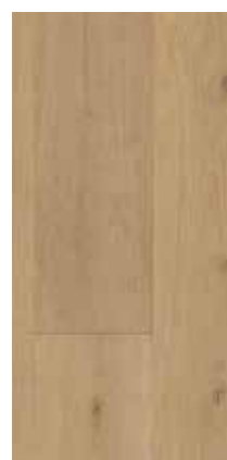
6291 Eiche Schoki XXL