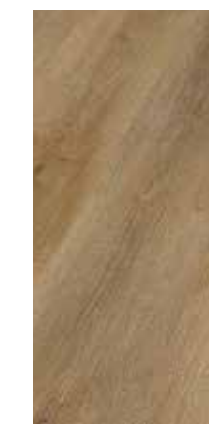
6288 Eiche Mojave XL