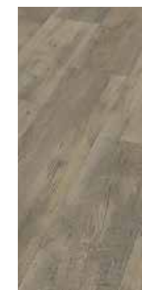
6042 Eiche Hasel grau