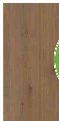
6102 Eiche Elsass XXL