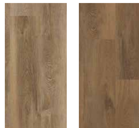
6125 Eiche Aspen 6126 Eiche Dallas