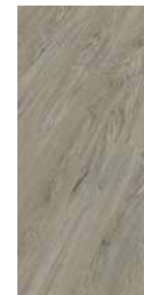
6029 Eiche Yola