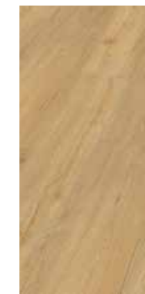
6034 Eiche Carmella