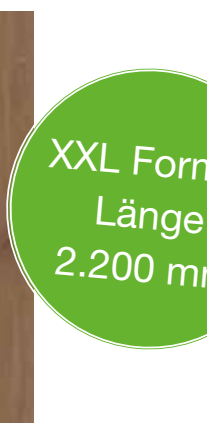
6047 Eiche Cream